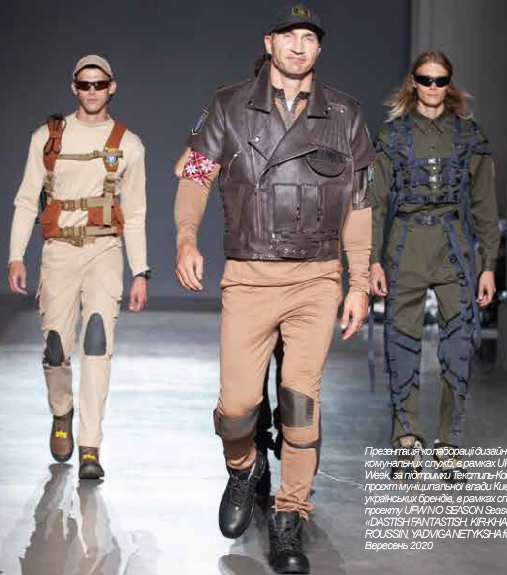
Презентація колаборації дизайнерів для комунальних служб, в рамках Ukrainian Fashion Week, за підтримки Текстиль-Контакт Спільний проєкт муніципальної влади Києва та українських брендів, в рамках спеціального проєкту UFWNO SEASON Season у показі «DASTISH FANTASTISH, KIR-KHARTLEY, ROUSSIN, YADVIGANETYKSHA for Kyiv» Вересень 2020