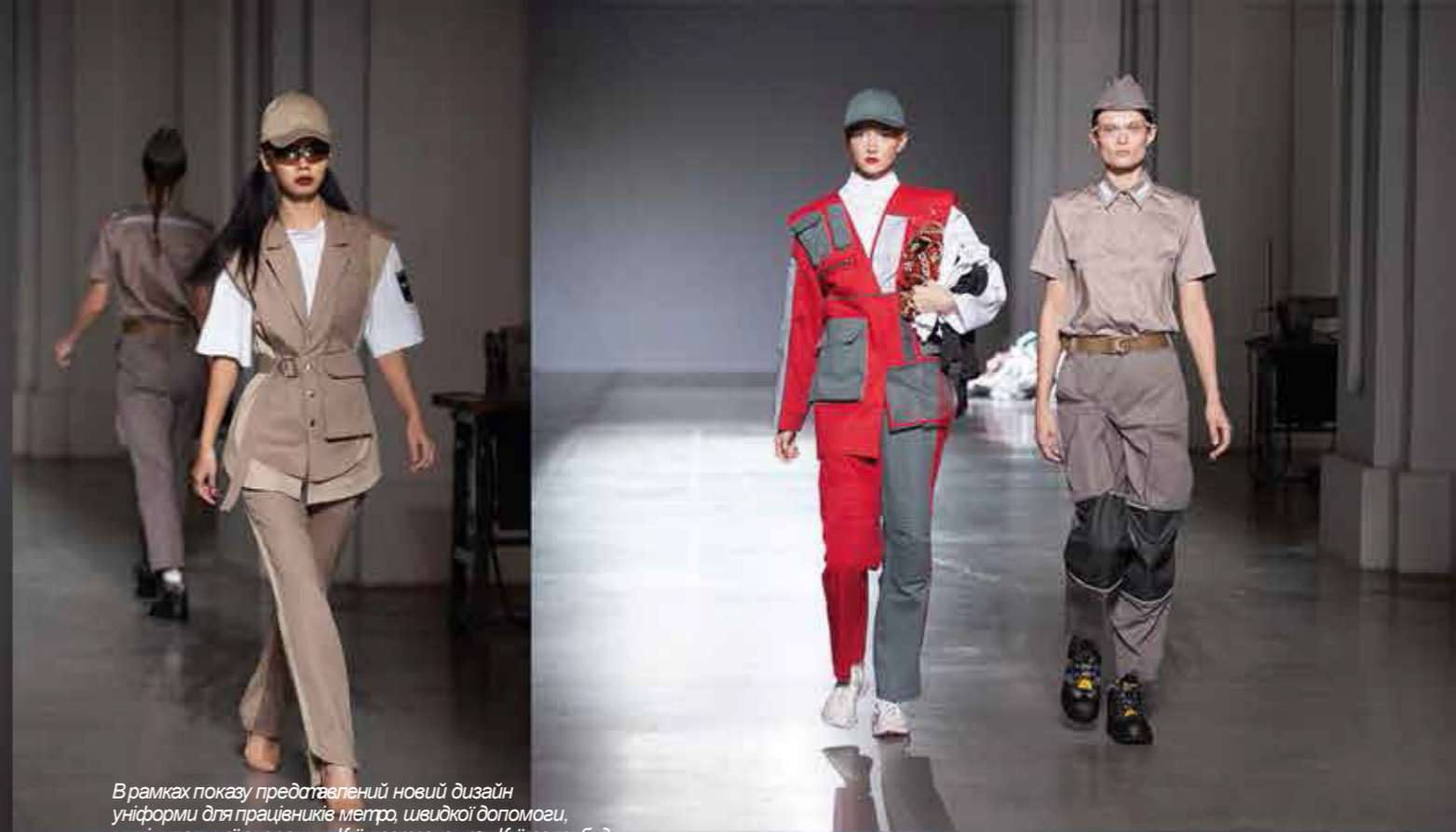
В рамках показу представлений новий дизайн уніформи для працівників метро, швидкої допомоги, муніципальної охорони, «Київгазтранс» та «Київзеленбуд».